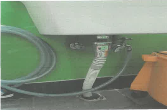
지하 1층 여자 화장실 세면대 팝업교체 막힘 통수.