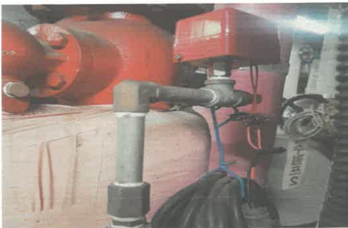
지하2층 기계실 알람벨브 압력스위치 불량. 청소 및 복구