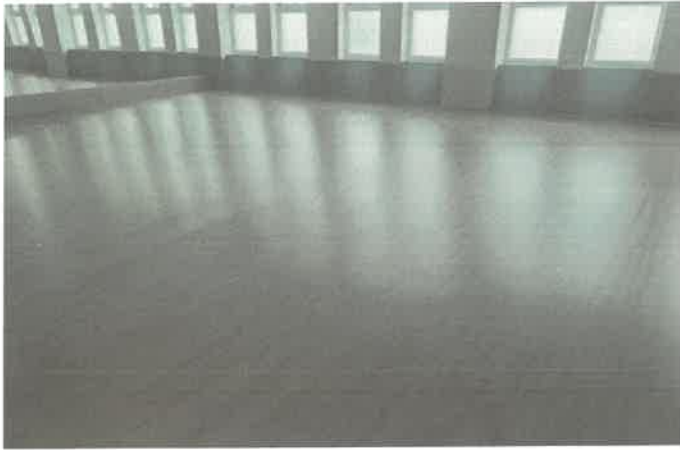
3층 강당 바닥 마루 이격전체 정리 및 마감 물딩시공.