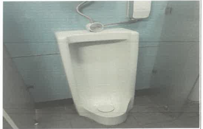
지하1층 남자 화장실 1층 남자 소변기 배관 커팅 절개 내부 침전물 제거 봉합 처리 작업.